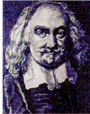
Thomas Hobbes 1588–1679