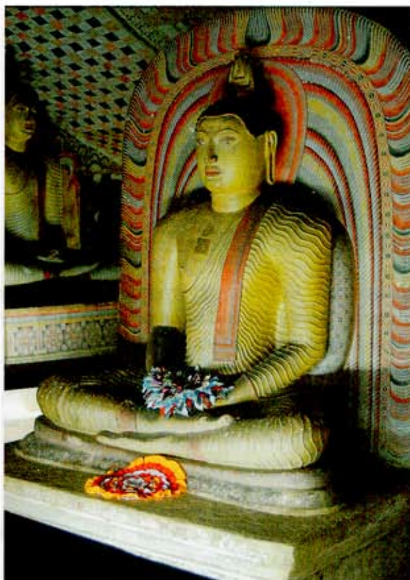
UNESCO:n maailmanperintökohde, Sri Lanka, Dambulla