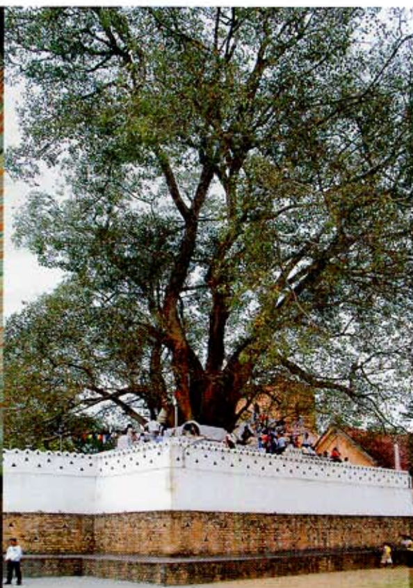
UNESCO:n maailmanperintökohde, Sri Lanka, Anuradhapura