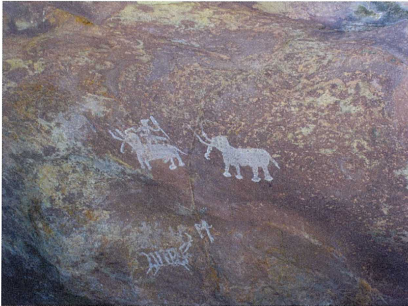
Bhimbetka, Intia Kuva: Tykografi 2008