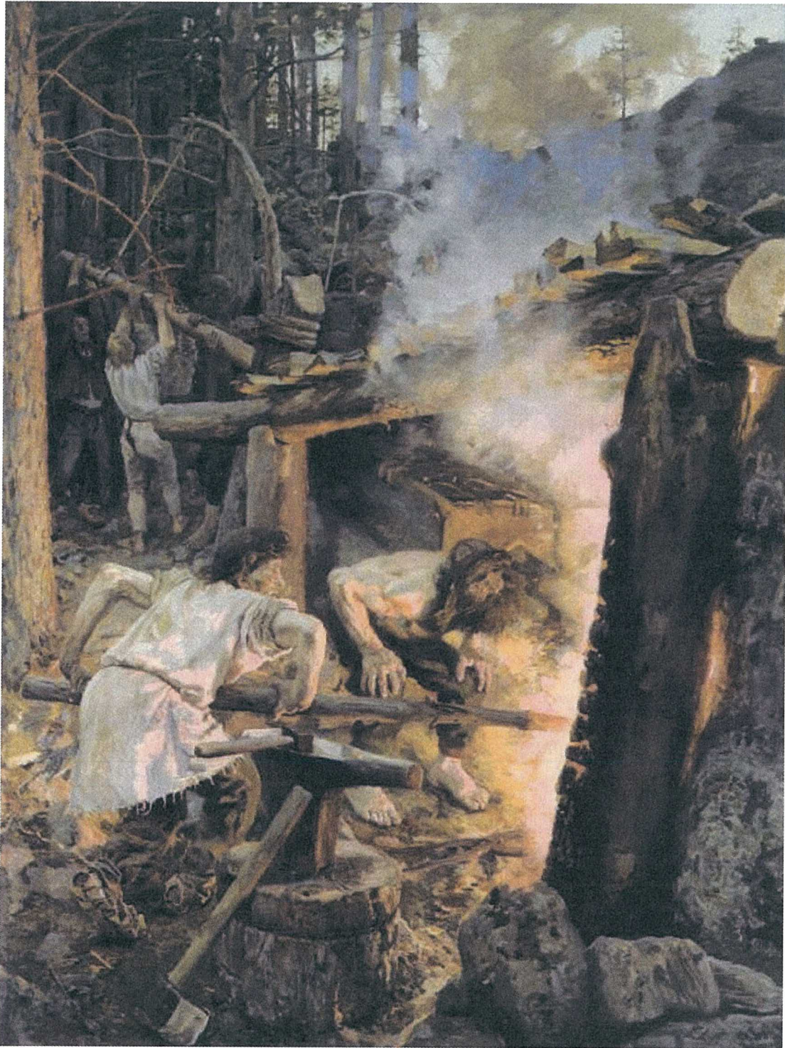
Sammon taonta , Akseli Gallen-Kallela, 1893 öljy kankaalle, 200 x 152 cm Ateneum